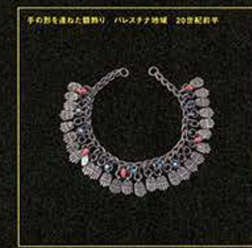
手の形を連ねた鎖飾り バルカン地域 20世紀前半