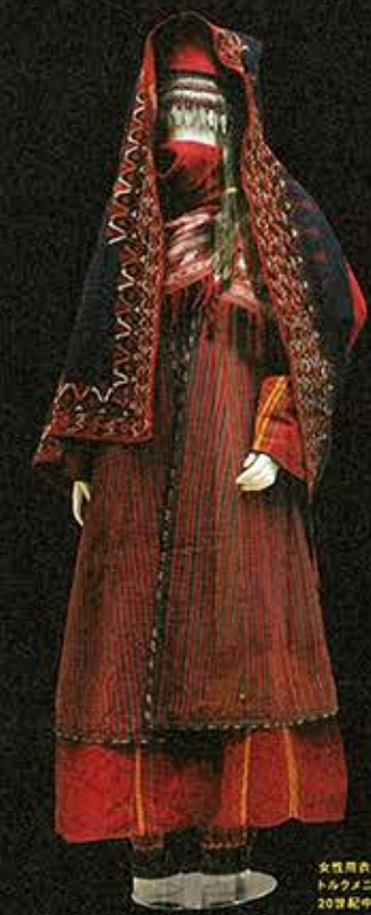
女性用長袖 トルクメニスタン 20世紀中期