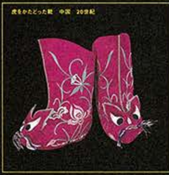
虎をかたどった靴 中国 20世紀