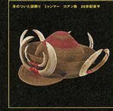
目のついた鎖飾り ミンマー人 ローマン 20世紀後半