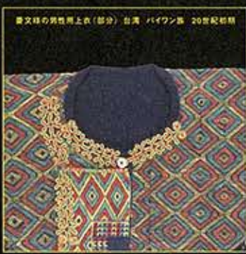
書文様の男性用上衣(部分) 台湾、ハイワン族 20世紀初期