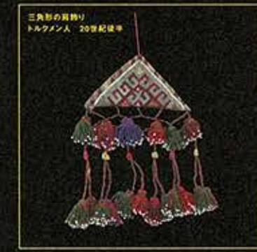
三角形の貝飾り トルクメン人 20世紀後半