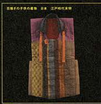
百練子の子供の着物 日本、江戸時代末期