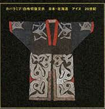
カバラミ(白布切替文衣) 日本・北海道 アイヌ 20世紀