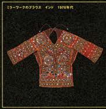
ミラーワークのブラウス インド 1970年代