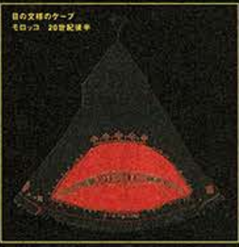
目の文様のケープ モロッコ 20世紀後半