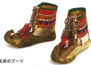
毛皮のブーツ ノルウェー 1970年代

Ideas from Traditional Clothing to Manage Cold Seasons