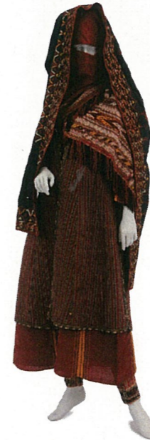
女性用衣装 トルクメニスタン 20世紀後半