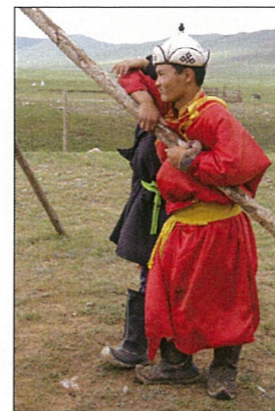
モンゴル