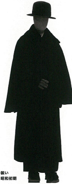
男性の装い 日本 昭和初期