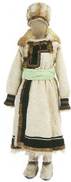
女性用衣装 アルタイ共和国 20世紀後半

寒さによる身体の冷えは私たちの健康に大きな影響を及ぼします。また寒さと一口に言っても、年間を通して雪や氷に覆われる厳寒の地域、四季の中で冬が寒い地域、一日の気温差が大きく夜間の冷え込みによって素材や形態がそれぞれの寒さに対処できるよう工夫がなされています。本展では中央アジア、ヨーロッパなど寒い地域の民族衣装を紹介し、その工夫を探ります。これらの衣装からは、私たちが冬を快適に過ごすヒントを見出すことができるでしょう。