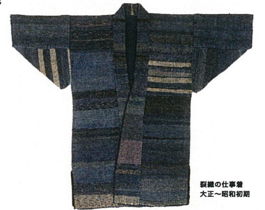
職織の仕事着 大正～昭和初期

Ideas from Traditional Clothing to Manage Cold Seasons