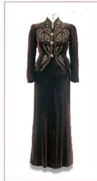
イギリス 1937-38年 スキヤパレリ