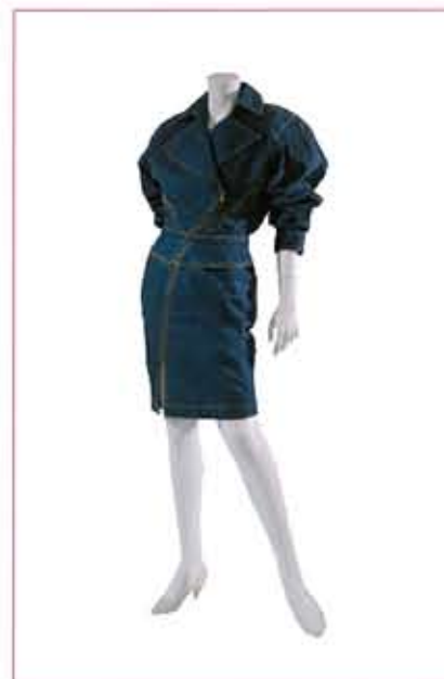
アメリカ 1986年 アライ