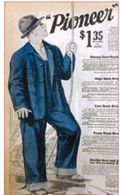
アメリカの雑誌キプロス 1936年 文化学園大学図書館蔵