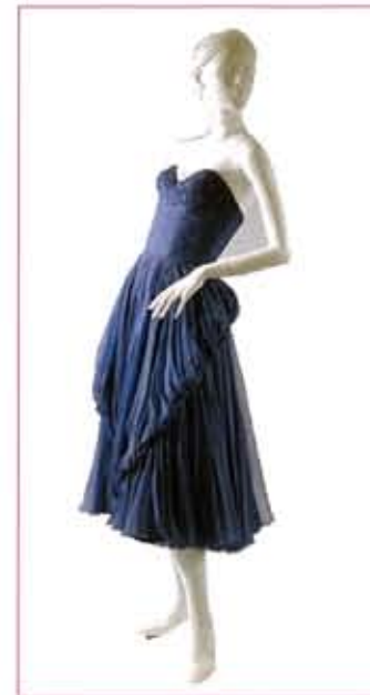
イギリス 1953年頃 ジェーン・アストン