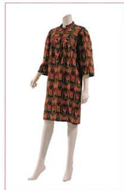
フランス 1970年代 イヴ・サンローラン