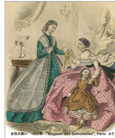
女性の装い 1865年 "Magasin des Demoiselles", Paris より