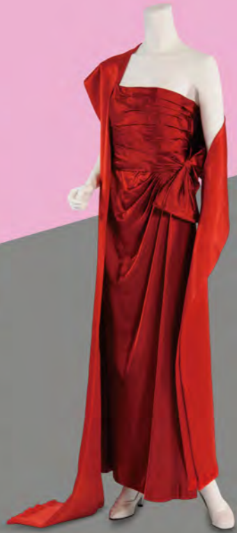
ドレス 1979年 ニナ・リッチ 越路吹雪着用