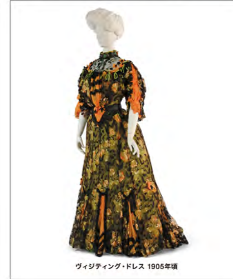
ヴィジティング・ドレス 1905年頃