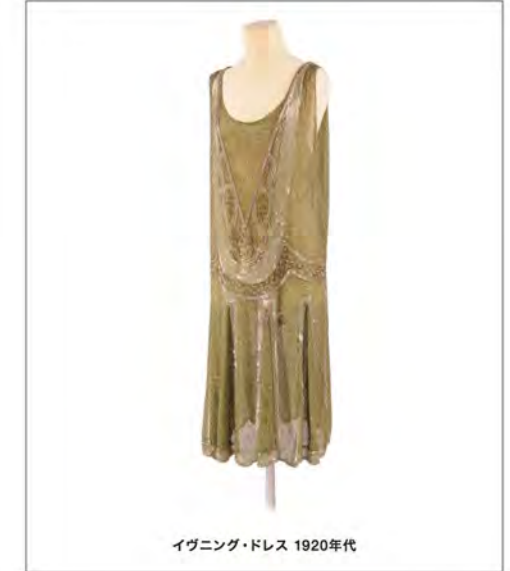
イブニング・ドレス 1920年代