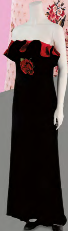
ドレス 1979年 ニナ・リッチ 越路吹雪着用