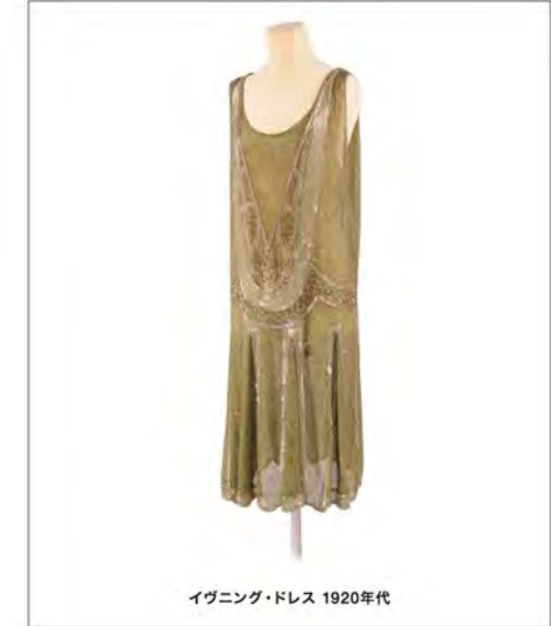
イブニング・ドレス 1920年代