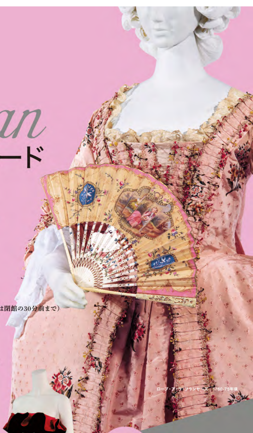
ローブ・ア・ラ・フランセーズ 1760-75年頃

ギャラリートーク | 3月17日(土)13:30～ ※12:30より受付順30名