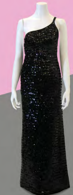
ドレス 1975年 サンローラン 越路吹雪着用