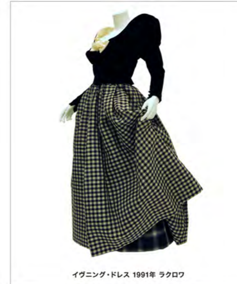
イブニング・ドレス 1991年 ラクロワ