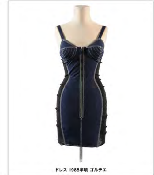
ドレス 1988年頃 ゴルチエ