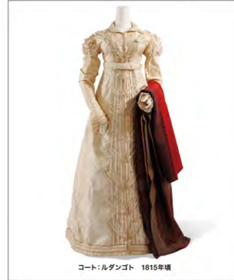
コート:ルダゴト 1815年頃

宮廷が流行を生み出した18世紀のロココ時代から、産業の発達や社会の成熟とともに変化する19世紀を経て、若者や大衆が流行の担い手となった20世紀末まで、ヨーロッパを発信元とする約250年の女性モードの変遷を、その社会背景とともに紹介します。 また特集として、越路吹雪のドレスを取り上げます。越路吹雪(1924-80)は、日本語歌詞によるシャンソンを普及させ、エレガントな雰囲気と歌声で人々を魅了しました。リサイタルやディナーショーでは最高のパフォーマンスを披露するため、パリのオート・クチュールで仕立てたドレスを舞台衣装としました。本展では、エンターテイナーとしての彼女のこだわりが詰まった約20点のドレスを出品します。