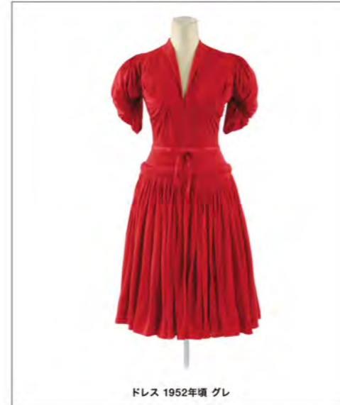
ドレス 1952年頃 グレ