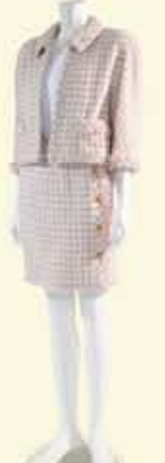
スーツ 1992年 シャネル