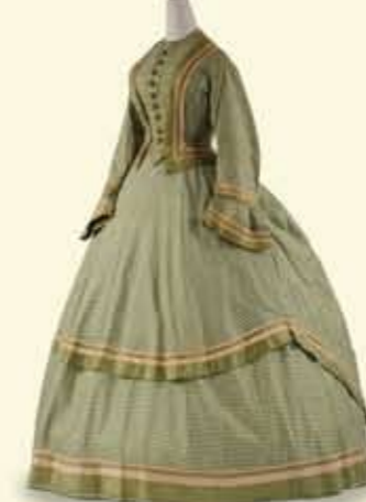
デイ・ドレス 1865-70年頃