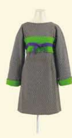
ドレス「カブキ」 1963年頃 ルディ・ガンライヒ