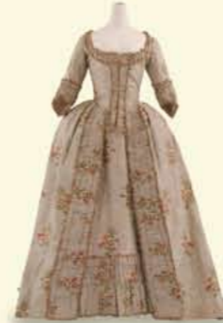
ローブ・ア・ラ・フランスーズ 1760-80年頃

宮廷が流行を生み出した18世紀のロココ時代から、産業の発達や社会の成熟とともに変化する19世紀を経て、若者や大衆が流行の担い手となった20世紀末まで、ヨーロッパを発信元とする約250年の女性モードの変遷を、その社会背景とともに紹介します。また特集として、20世紀のモードにみる「日本」を取り上げます。19世紀半ば以降のジャポニスムのブーム、1960—70年代のフォークロア・ブームなどは、着物の要素を取り入れたドレスを生み出しました。単なる模倣にとどまらず、新たな創造へと飛躍したドレスを展示します。