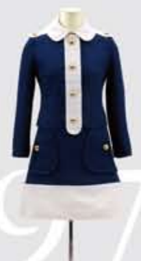
日本万国博覧会協会 ホステス制服 1970年