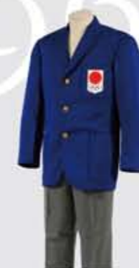
東京オリンピック 役員制服 1964年