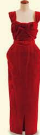
イブニング・ドレス 1953年頃 クリスチャン・ディオール