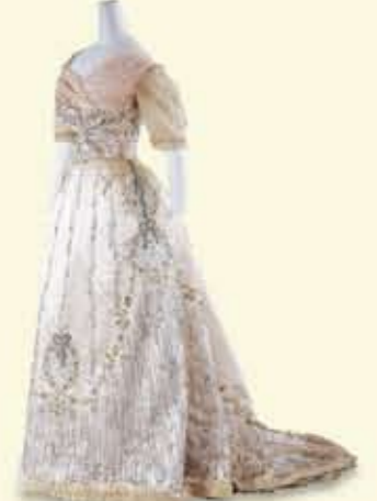
イブニング・ドレス 1898年頃