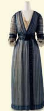
デイ・ドレス 1910年頃 ウォルト