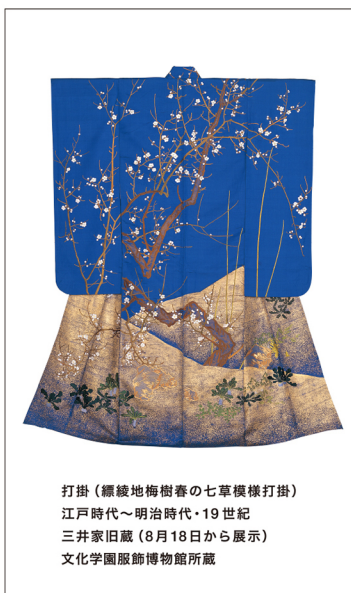
打掛 (標織地梅樹春の七草模様打掛) 江戸時代～明治時代・19世紀 三井家旧蔵(8月18日から展示) 文化学園服飾博物館所蔵