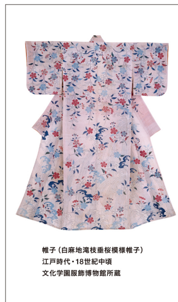
帷子 (白麻地滝枝垂桜模様帷子) 江戸時代・18世紀中頃 文化学園服飾博物館所蔵