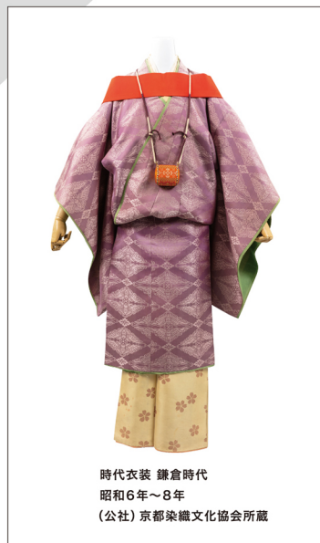
時代衣装 鎌倉時代 昭和6年～8年 (公社)京都染織文化協会所蔵