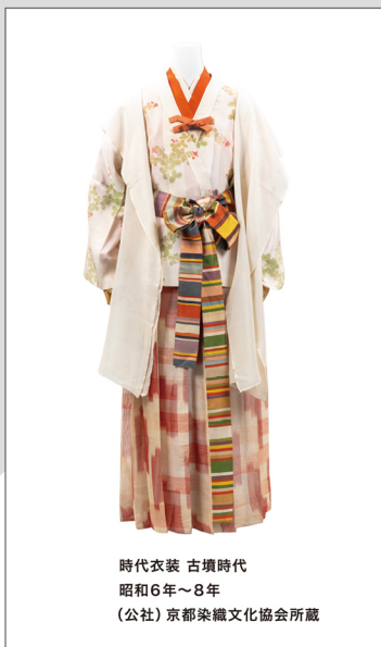
時代衣装 古墳時代 昭和6年～8年 (公社)京都染織文化協会所蔵

平安遷都以降、貴族や武家、そして裕福な町人の華やかで贅沢な衣生活を支えたのが、都の工人たちでした。応仁の乱で京が一時灰燼に帰すことがあっても、工人たちはこうした苦難を乗り越え、新たな染織技術を次々に生み出して現代に至っています。しかしその間、京都の染織が一時低減することもありました。昭和6年(1931年)、京都の染織業の振興を図るために行われたのが京都染織祭でした。本展覧会では、当時の京都の染織技術を結集して復元された、古墳時代から明治時代初期に至る女性の衣服を展示して日本の女性の服装の1500年をたどるとともに、当館所蔵の江戸時代後期から昭和時代初期の優品を通して京都の染織技術の真髄を感じていただきたいと思います。