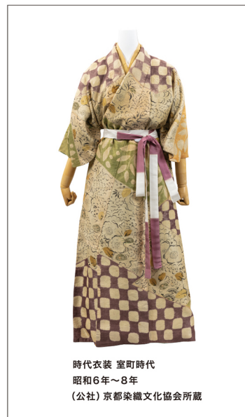
時代衣装 室町時代 昭和6年～8年 (公社)京都染織文化協会所蔵