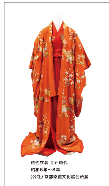
時代衣装 江戸時代 昭和6年～8年 (公社)京都染織文化協会所蔵