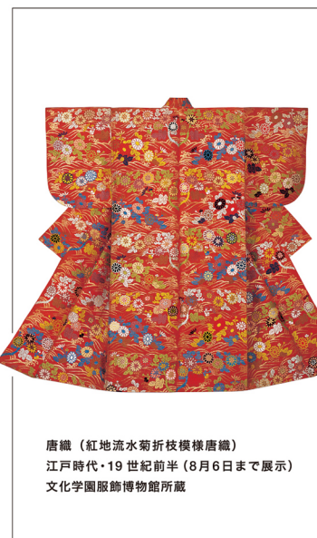
唐織 (紅地流水菊折枝模様唐織) 江戸時代・19世紀前半(8月6日まで展示) 文化学園服飾博物館所蔵