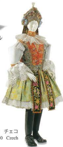
女性用衣装 1970年 チェコ Woman's costume 1970 Czech