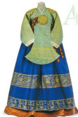
唐衣 1920年頃 朝鮮 Ceremonial costume : Dangui c.1920 Korea