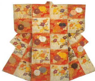
能装束 江戸時代後期 近江彦根藩主・井伊家旧蔵 Noh robe Late 18th to mid-19th century