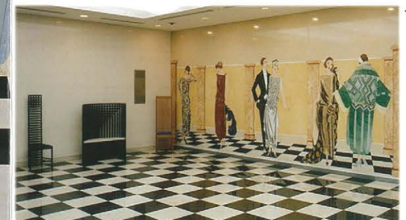
←1階ロビー 壁面のモザイク画 オプス・セクティ 技法によってフィ ンツェで制作され もの。文化学園 母体が創設され 1923年当時のフラ スのファッション 「アル・グー ーテ」の中のイラ トをもとにしてい