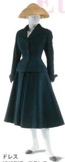
ドレス 1948年頃 フランス クリスチャン・ディオール Dress c.1948 France Christian Dior