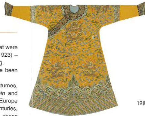
龍袍 18世紀中頃 中国 Dragon robe : Long pao Mid-18th century China