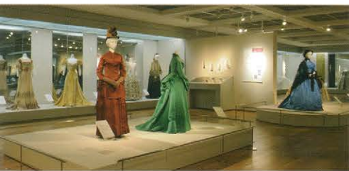
←ヨーロッパのドレス

Bunka Gakuen Costume Museum is affiliated with Bunka Gakuen Educational Foundation and is a specialized garment museum of which there are few in Japan. Bunka Gakuen was established in 1923 and comprises of Bunka Gakuen University, Bunka Fashion College, Bunka Fashion Graduate University, Bunka Fashion Research Institute, a library, museum, and publishing bureau. As a general fashion education institution it is central to fashion education in Japan and produces a large number of graduates for the fashion industry. When Bunka Gakuen was established there was a plan to create a specialist apparel museum for research and education purposes based on original, high quality items. Bunka Gakuen Costume Museum was opened in 1979 and in commemoration of Bunka Gakuen's 80th anniversary in 2003 it moved to its present location in the Shinjuku Quint Building which is located along Koshu main road. Bunka Gakuen Costume Museum is a specialist university-affiliated museum that specializes in clothing – a fundamental element of everyday life. It is our hope that the museum's garments which have been collected for academic purposes will be made available to the general public and contribute towards the promotion of knowledge.