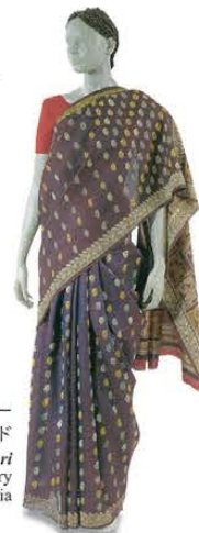
サリー 19世紀 インド Sari 19th century India