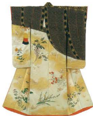
打掛 江戸時代後期 三井家旧蔵 Uchikake Late 18th to mid-19th century