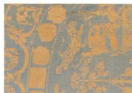
正倉院裂 奈良時代 Shosoin textile 8th century