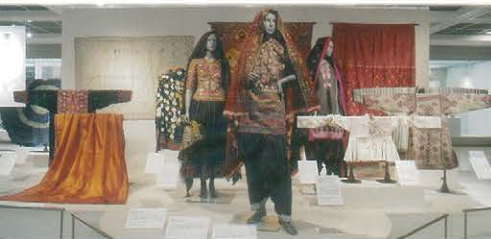
←南アジアの民族衣装