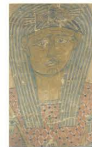
ミイラ覆い布 1-3世紀 エジプト Mummy cloth 1-3 century Egypt