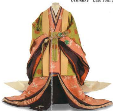
五衣・唐衣・裳（十二単）明治42年 北白川宮房子妃着用 Itsutsuginu Karaginu Mo (Junihitoe) 1909 Worn by Princess Fusako Kitashirakawa