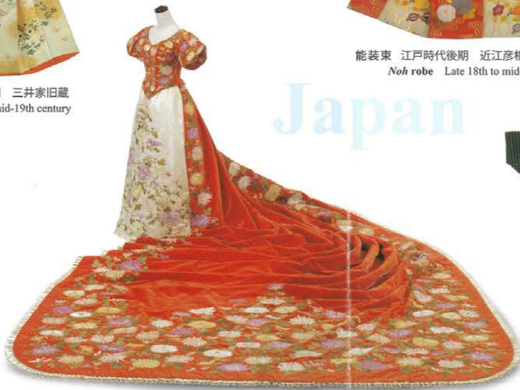
御大礼服 明治20年代後半 昭憲皇太后着用 Manteau de cour c.1895 Worn by Empress Meiji