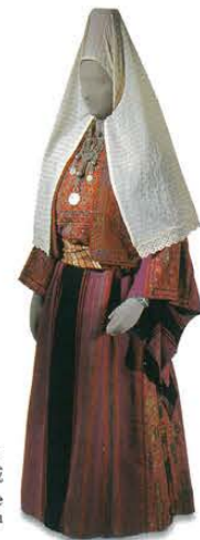
女性用衣装 1915年頃 パレスチナ地域 Woman's costume c.1915 Palestine area