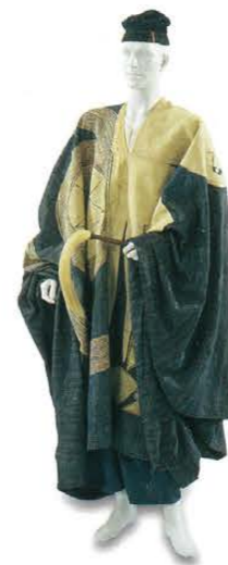
男性用衣装 20世紀中頃 ナイジェリア Man's costume Mid-20th century Nigeria