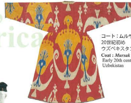
コート：ムルサク 20世紀初め ウズベキスタン Coat : Mursak Early 20th century Uzbekistan