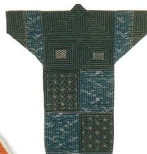
仕事着 明治一昭和時代初期 Working clothes Late 19th to early 20th century