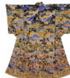
着物 型友禅 昭和時代前期

化学染料を用いた型友禅による染染は、それまでの防染を基本とする型染の概念を一変させる画期的な新技法でした。それまでは、色鮮やかな友禅染めの着物を着用できるのは富裕層に限られていましたが、染染により大量生産が可能となり、女性たちの着物は一気に華やいものになりました。