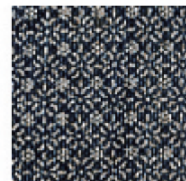
小紋(部分) 小紋 江戸時代後期