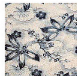
浴衣(部分) 中形 明治時代