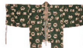
浴衣 板締 江戸時代後期

型染の衣服は、江戸時代中期頃まで主に武家に用いられていましたが、その後は町人にも広まり、江戸時代後期には木綿地に中形で文様を表した浴衣が庶民の夏の衣服として広く用いられました。量産に向く型染は、日常着の文様を染めるのに多用され、幅広い人々に愛用されました。