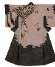
下着 小紋 明治時代

明治時代の型染は、さらなる技術の向上を目指して、より精緻なものへと進歩していきました。複数の型を寸分違わず合わせて複雑な文様を染めたり、刺繍などと組み合わせることで表現の幅を広げていくなど、様々な試みが行われました。