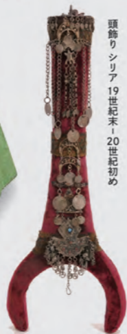
頭飾りシリア 19世紀末-20世紀初め