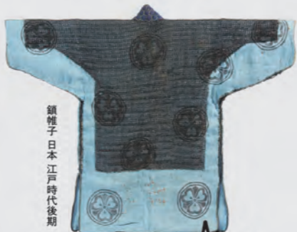
領種子 日本 江戸時代後期