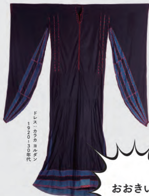
ドレス・カラカヨルダン 1970-130年代

世界には私たちがまだ見たこともない、想像を超えるような驚くべき衣服がたくさんあります。それらはそれぞれの国や地域で、気候への適応や外敵からの防御など、生命の維持につながる何らかの意味を持ったり、それぞれの文化で培われた思想に基づいたものでもあります。本展ではさまざまな地域の衣服や付属品などを、「ながい」「おおきい」「まるい」「たかい」などの特徴に分けて紹介します。同時に、フォルムの持つ面白さばかりではなく、どうしてそのような形状になったのか、それぞれの形の持つ意味も探ります。約30か国のバラエティーあふれる衣服からは、思いもよらない発想や驚きの知恵など、私たちの固定観念を超えた多様な衣服造形を感じていただけることでしょう。