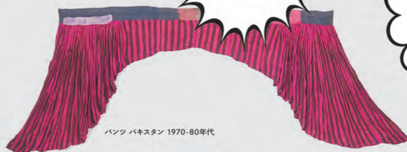
パンツ パキスタン 1970-80年代