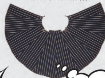
丸合羽 日本 江戸時代後期