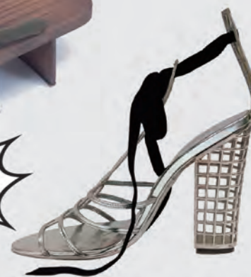
靴 フランス イヴサンローラン 1990年代