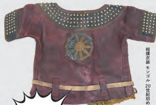
相模衣装 モンゴル 20世紀初め