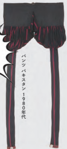
パンツ パキスタン 1980年代