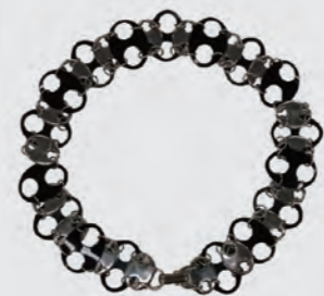
ベルト バコ・ラバヌ 1990年代