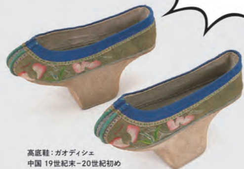
高底鞋：ガオディシエ 中国 19世紀末-20世紀初め