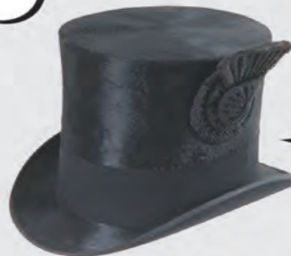
シルクハット イギリス 1878-90年頃