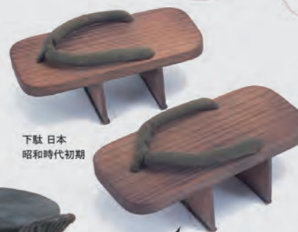
下駄 日本 昭和時代初期