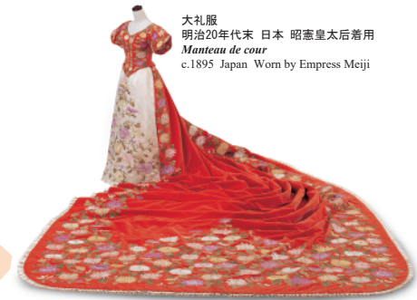
大礼服 明治20年代末 日本 昭憲皇太后着用 Manteau de cour c.1895 Japan Worn by Empress Meiji