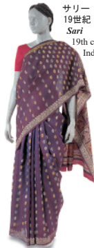
サリー 19世紀 インド Sari 19th century India