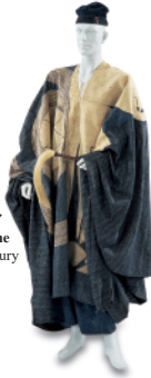
男性用衣装 20世紀中頃 ナイジェリア Man's costume Mid-20th century Nigeria