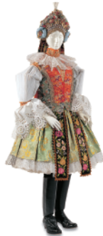
女性用衣装 1970年 チェコ Woman's costume 1970 Czech