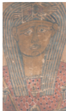
ミイラ覆い布 プトレマイオス王朝時代(前305-前30) エジプト Mummy cloth Ptolemaic dynasty (BC.305-BC.30) Egypt