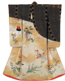
打掛 江戸後期~明治初期 日本 Uchikake Late 18th to mid-19th century Japan

文化学園服飾博物館のコレクションは、日本、アジア、ヨーロッパ、アフリカ、中南米など広い地域の服飾、染織品に及んでいます。日本では小袖、近代の宮廷衣装、能装束など、ヨーロッパでは18世紀から20世紀のドレスや服飾品、オート・クチュールのデザイナーの作品、また世界各地の民族衣装や染織品など、約20,000点を数えます。これらの所蔵品の一部はホームページ上でも公開されています。