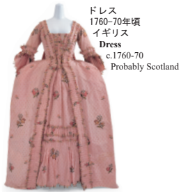
ドレス 1760-70年頃 イギリス Dress c.1760-70 Probably Scotland

To know cultures in Japan and around the world through clothes