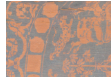
正倉院製 奈良時代 日本 Shosoin textile 8th century Japan