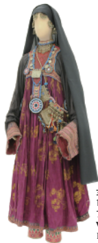
女性用衣装 1970-80年代 アフガニスタン Woman's costume 1970-80s Afghanistan