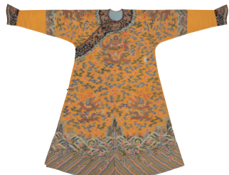
龍袍 18世紀中頃 中国 Dragon robe: Long pao Mid-18th century China