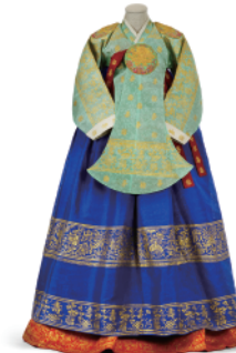
女性用衣装 1920年頃 韓国 Woman's costume c.1920 Korea