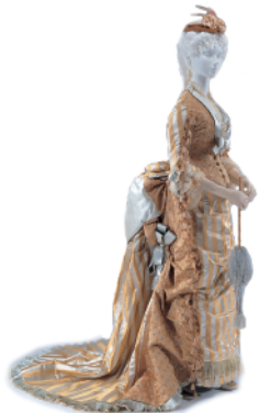
ドレス 1875年頃 イギリス Dress c.1875 Great Britain