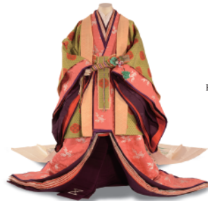
五衣・唐衣・裳(十二単) 明治42年 日本 Itsutsuginu Karaginu Mo (Junihitoe) 1909 Japan