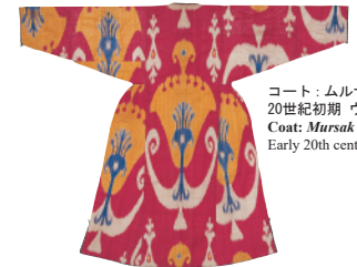
コート: ムルサク 20世紀初期 ウズベキスタン Coat: Mursak Early 20th century Uzbekistan