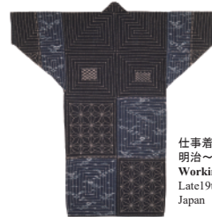
仕事着 明治~昭和時代初期 日本 Working clothes Late19th to early 20th century Japan